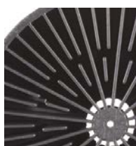
200 l (55 galonów)