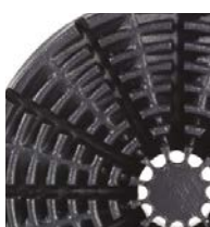
20 l (5 galonów)