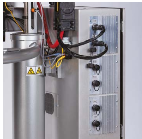
Sześć punktów przyłączeniowych do 12 stref podgrzewania określonych przez klienta

Firma Graco oferuje całą linię systemów topienia materiałów termotopliwych Therm-O-Flow oraz systemy do topienia w miejscu użycia – każdy model można skonfigurować do konkretnych zastosowań.