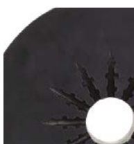
20 l (5 galonów)