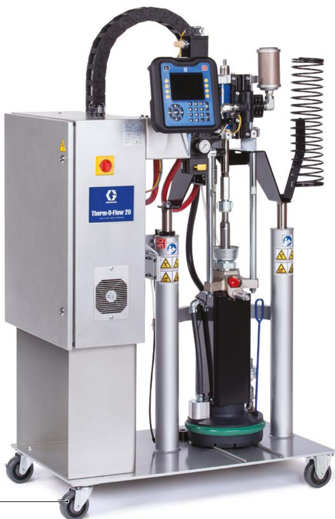
Therm-O-Flow 20 litrów