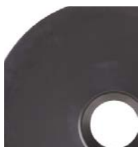
200 l (55 galonów)