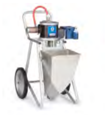
ToughTek M680a CS

ToughTek M680a 活塞泵可处理环氧砂浆、耐磨防滑涂料（桥梁和船舶业——溶剂型涂料）或水泥基材料等高研磨性材料，亦可游刃有余地应对难以处理、含有玻璃微片、硅、砂等填料的聚合物。全不锈钢设计可轻松、安心地清洁环氧砂浆。