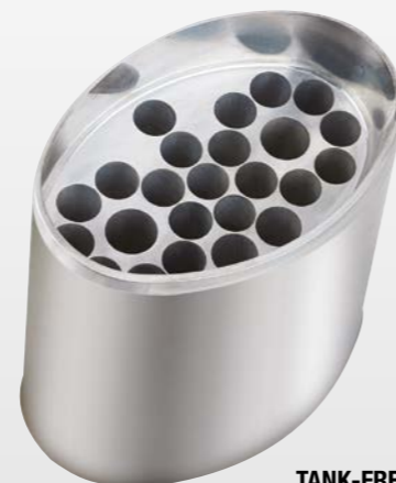
TANK-FREE™ SANS RÉSERVOIR