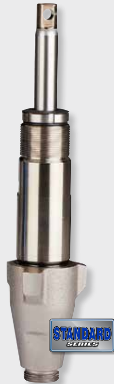
Pompe Endurance Chromex MC

LA MEILLEURE POMPE ATTEINT DE NOUVEAUX SOMMETS LA TECHNOLOGIE DE PISTON ROTATIF VORTEX VOUS PERMET DE VENIR À BOUT DE TOUS VOS TRAVAUX