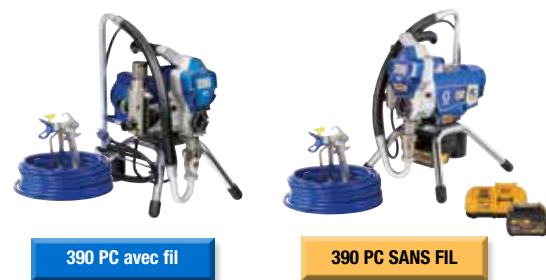
390 PC avec fil