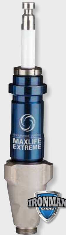
Pompe Endurance Vortex MaxLife Extreme

Dure six fois plus longtemps entre les remises en état