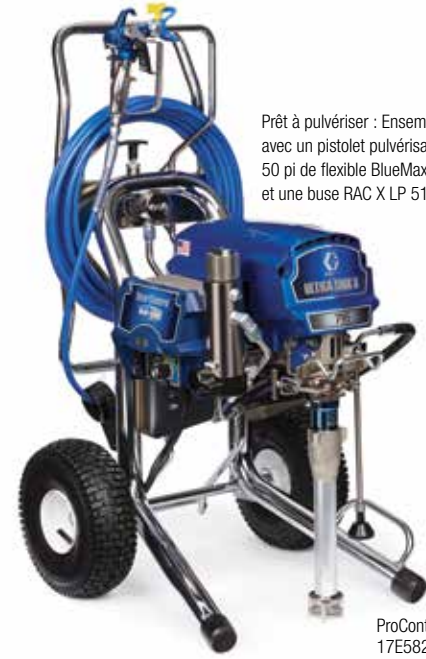
Prêt à pulvériser : Ensemble complet avec un pistolet pulvérisateur Contractor PC, 50 pi de flexible BlueMax II et une buse RAC X LP 517 SwitchTip