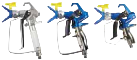
Contractor FTx® 288438 Contractor PC 17Y043 Contractor PC Compact 19Y350