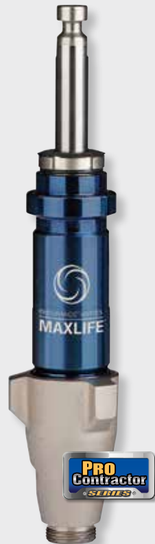
Pompe Endurance Vortex MaxLife

Dure deux fois plus longtemps que les pompes des concurrents