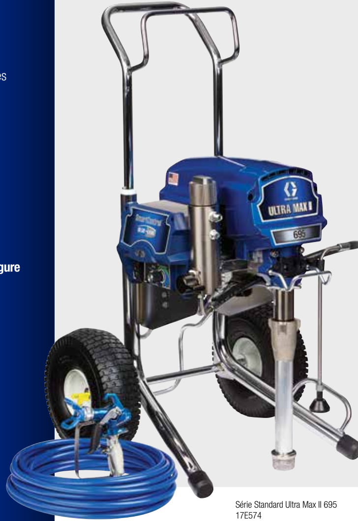
Série Standard Ultra Max II 695 17E574

Prêt à pulvériser: Ensemble complet avec un pistolet pulvérisateur Contractor PC, 50 pi de flexible BlueMax II et une buse RAC X LP 517 SwitchTip