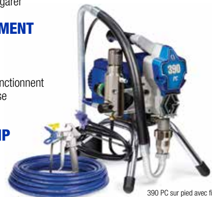
390 PC sur pied avec fil 17C310