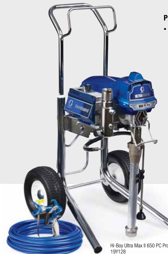
Hi-Boy Ultra Max II 650 PC Pro 19Y128