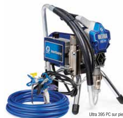
Ultra 395 PC sur pied 17E844