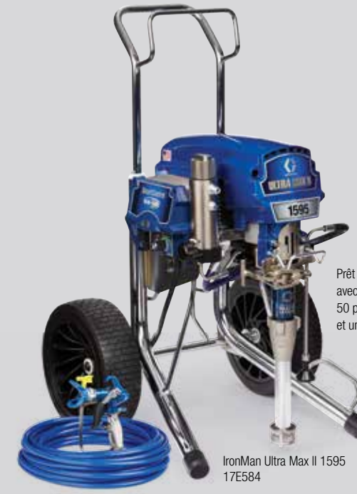
Prêt à pulvériser: Ensemble complet avec un pistolet pulvérisateur Contractor PC, 50 pi de flexible BlueMax II et une buse RAC X LP 517 SwitchTip