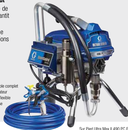
Sur Pied Ultra Max II 490 PC Pro 17E852

Prêt à pulvériser: Ensemble complet avec un pistolet pulvérisateur Contractor PC, 50 pi de flexible BlueMax II et une buse RAC X SwitchTip