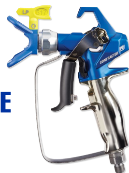
CONTRACTOR PC 17Y043