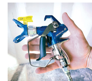
Contractor PC Compact 19Y350

Pivot EasyGlide MC pour un mouvement sans effort du flexible