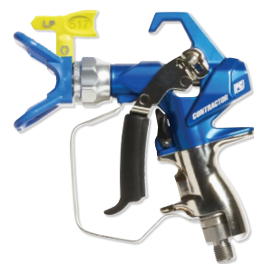
CONTRACTOR PC COMPACT 19Y350