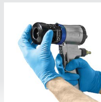
Luftkappe und Haltering installieren.