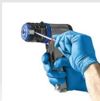
Retirez la cartouche