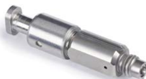
Flat Mix Chamber