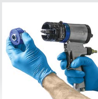
Insérez la nouvelle cartouche produit PC dans la chambre de mélange en exerçant une légère pression