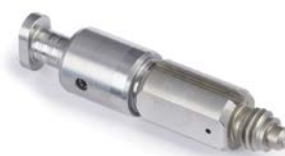
Round Mix Chamber