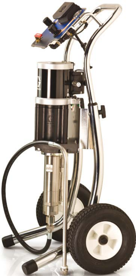
Levegőrásegítéssel, kocsira szerelt csomagok