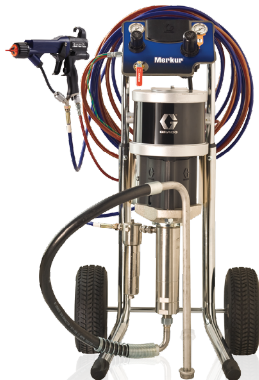
Kocsira szerelt csomag

*Minden csomag tartalmaz egy 7,5m (25 láb) hosszú földelt levegő és festék tömlő-szettet