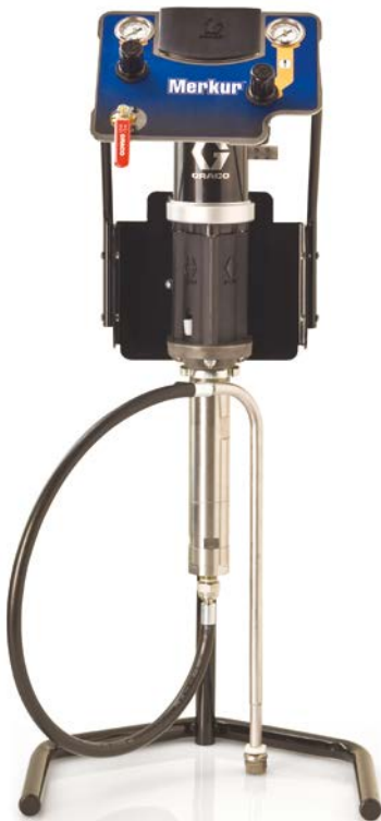
Levegőrásegítéssel, állványos csomag