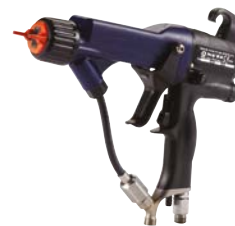
PRO Xp™ Levegőrásegítéssel elektrosztatikus rendszer