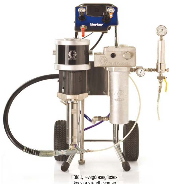
Fűtött, levegőrásegítéssel, kocsira szerelt csomag

*Minden csomagban egy darab 7,5 m (25 láb) hosszúságú folyadék- és levegőtömlő található