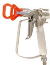
XTR™ Airless pisztoly