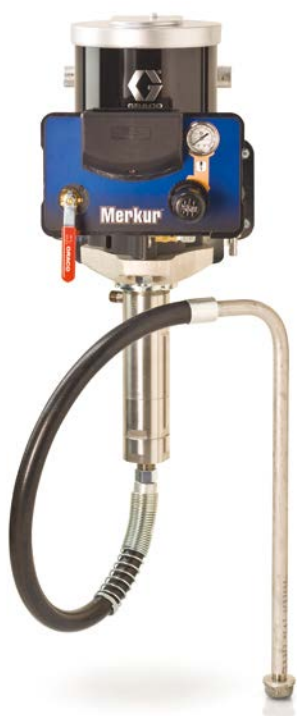
Falra szerelhető airless csomag

*Minden csomag tartalmaz egy 7,5m (25 láb) hosszú festék tömlőt