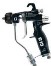
G15™ / G40™ Levegőrásegítéssel pisztoly