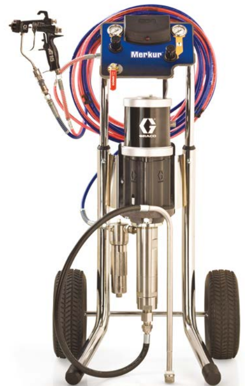
Levegőrásegítéssel, kocsira szerelt csomagok