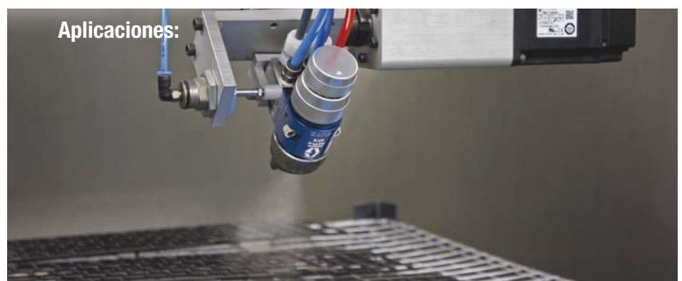
Aplicación automática con pistola de pulverización AirPro EFX™ de Graco