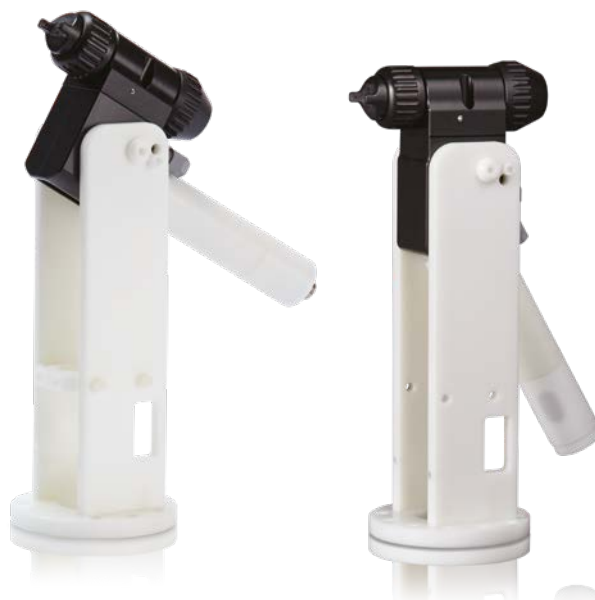
Распылитель с распределительным блоком с задним подключением и креплением для установки на робота

В моделях распылителей используется воздушная головка № 24N477 и сопло 1,5 мм № 24N616