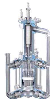
2500, 3000 и 4000 куб. см