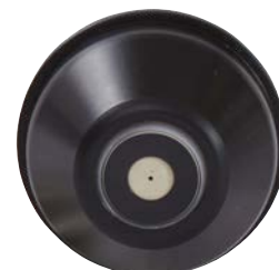
Cabezal de aire para pulverización circular